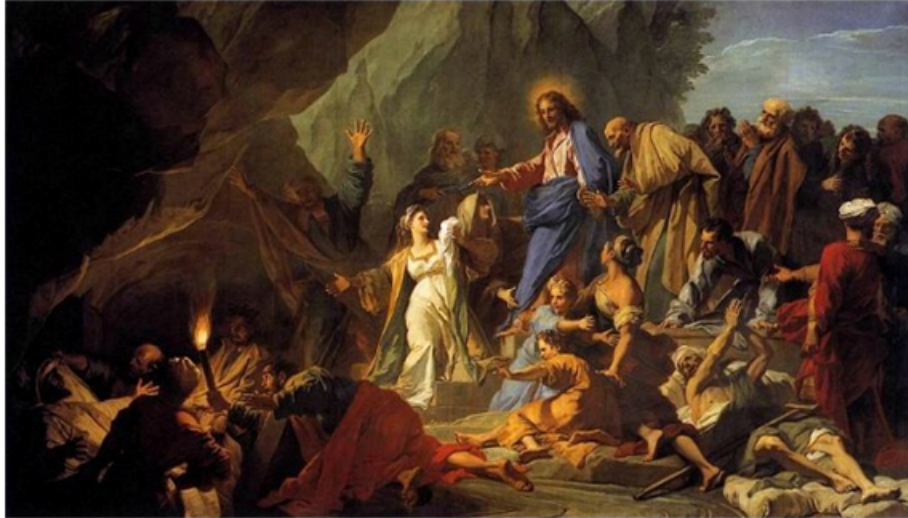
Jouvenet, Jean-Baptiste 'The Raising of Lazarus' 1706.

“주님, 주님께서 사랑하시는 이가 병을 앓고 있습니다.” (요한 11,3)