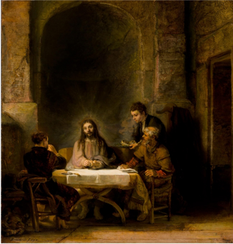
Rembrandt The Supper at Emmaus