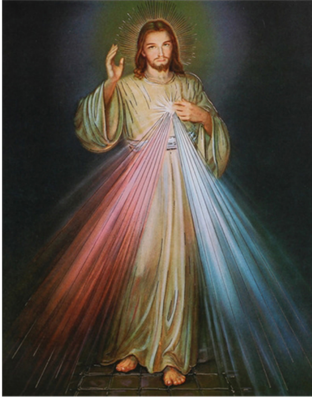
“양들은 그의 목소리를 알아듣는다.”(요한 10,3)