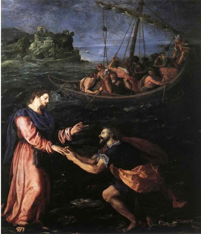
알레산드로 알로리, 물 위를 걷는 베드로, 1590년경, 유화, 47x 40cm, 우피치 미술관, 피렌체.