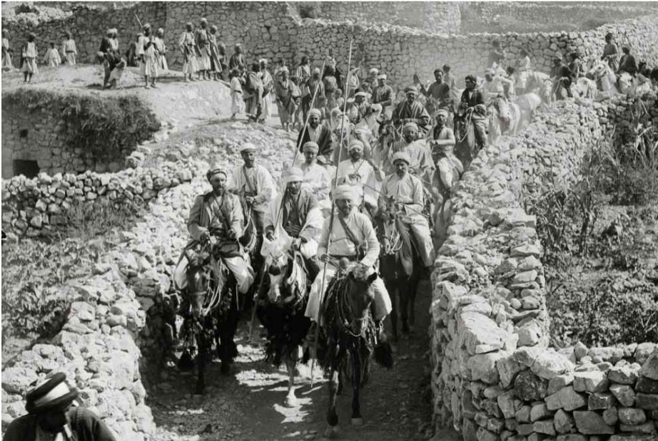
예루살렘 근처 아부 고시 마을의 혼인 행렬(1904년)

주임신부: 정연우(스테파노) 323-206-7322 보좌신부: 임태근(모세) 323-404-6543 종신부제: 예영해(프란치스코) 213-249-2127 전교수녀: 윤명덕(엔크라시아) 323-899-3925 이연자(유스타) 323-828-8876 사목회장: 박기종(프란치스코) 818-517-1148 총무: 조우제(아오스딩) 213-272-5135 연령회장: 한상윤(시몬) 323-821-4840