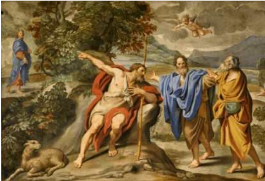
도메니키노 작품 '안드레아와 시몬(베드로)에게 예수님을 가리키는 요한 세례자'.